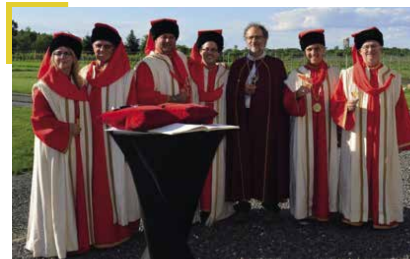
▲ Chapitre du 4 juin 2016 au domaine des 3 fûts, seul vignoble de la ville de Drummondville

Depuis sa fondation, le premier chapitre a eu lieu le 23 mai 1986 avec l'intronisation de 20 chevaliers, vingt-cinq chapitres se sont succédé qui ont permis d'introniser 106 Chevaliers ainsi que 13 officiers et Commandeurs.