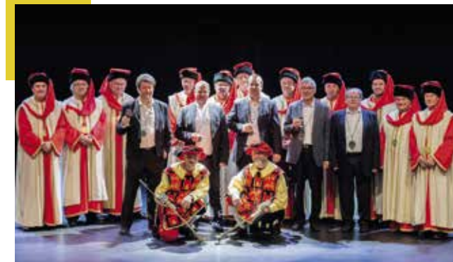
◀ Chapitre à Montreux