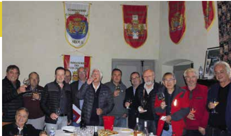
▲ Le bureau 2023