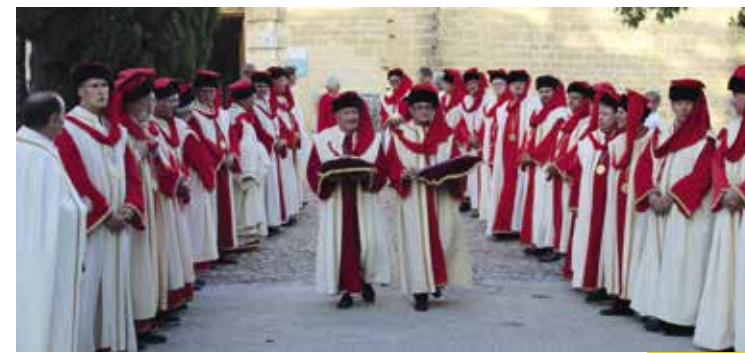
▲ Les commandeurs sur le ponceau du château de Suze

À ce jour (mars 2023), onze baronnies portent haut les couleurs de l'Appellation à travers le monde : une en Allemagne dans le Palatinat, trois au Canada (Montréal, Québec et Drummondville), une en Suisse (Montreux), deux en Belgique (Liège et Gand), deux aux USA (New York et Philadelphie), une en Corée du Sud (Séoul) et une en Chine (Shanghai).