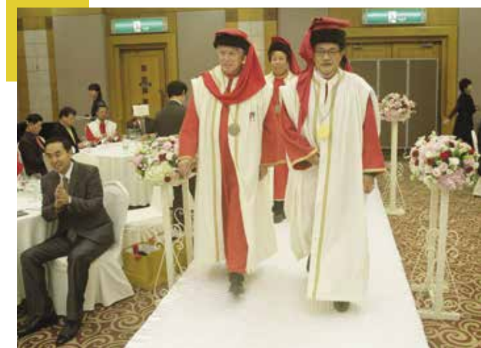
▲ Le grand Maître et le Consul de Séoul

Si trois politiques importants du parlement de la Corée sont venus rejoindre la Baronnie, on remarquait l'intronisation