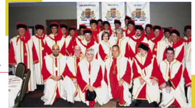
Chapitre au Canada ▶