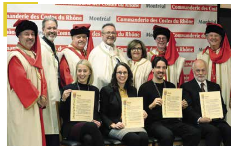
▲ Les intronisés du 85 ème chapitre du 17 novembre 2022 avec les Commandeurs et officiers de la Baronnie

Lors de ces 86 chapitres solennels, 489 personnalités des milieux de la culture, des arts, de la musique, du spectacle, des médias d'information, des métiers de bouche, de la sommellerie, du sport, de la politique et des affaires ont été intronisées Chevaliers et Chevalières de la Commanderie des Côtes du Rhône.