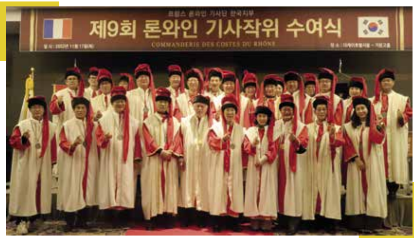
▲ Chapitre de novembre 2022 à Séoul

La Baronnie va fêter ses 10 ans cette année et sera bien présente avec une forte délégation en France pour les 50 ans de la Commanderie en juillet.