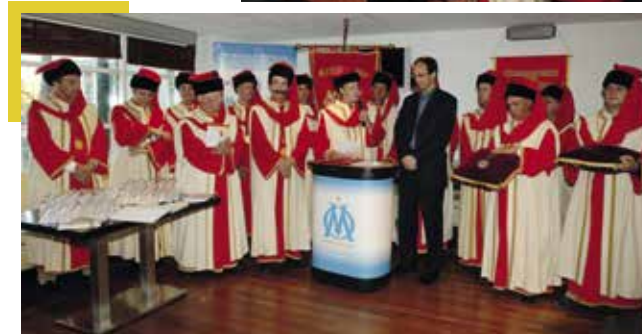
◀ Chapitre à Marseille