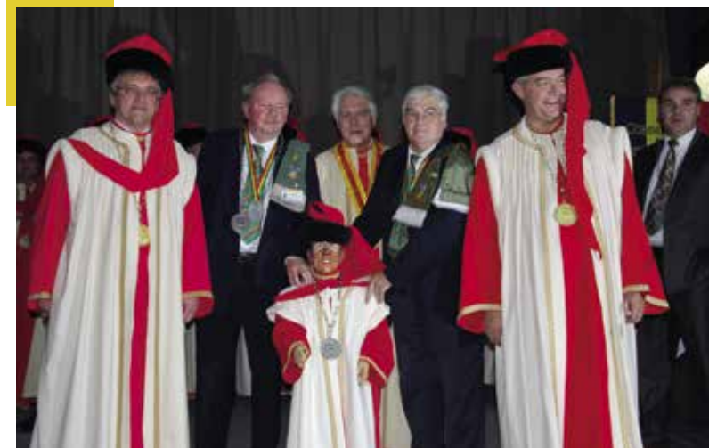
▲ Un commandeur nommé Tchanchès, personnage du folklore liégeois (2015)

Depuis sa création, au cours de 125 chapitres officiels, la Baronnie liégeoise