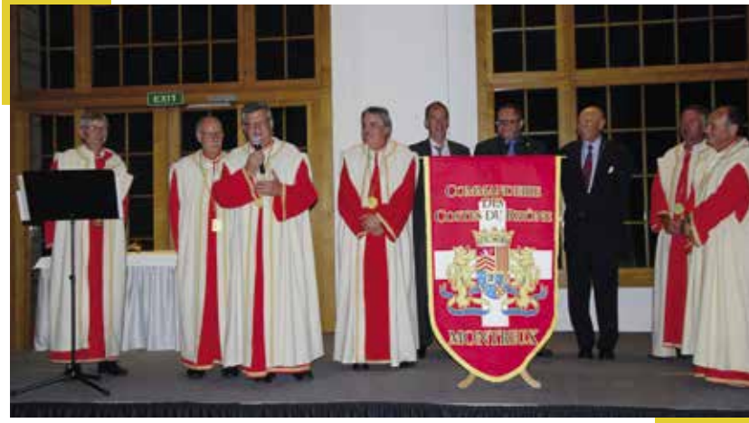
▲ Chapitre des 25 ans de la Baronnie en juin 2018

La santé est notre capital le plus précieux, afin que nous puissions, encore longtemps, faire tinter nos verres à la découverte de nouvelles perles de ces vins qui font notre bonheur et notre fierté.