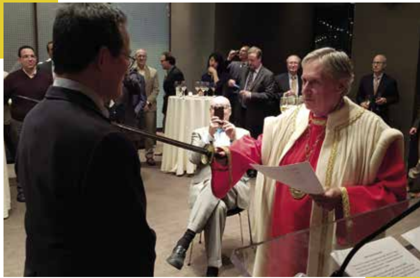
▲ Chapitre de décembre 2018 au restaurant Riverpark situé à Kips Bay, New York

La Baronnie de New York est active, conviviale et respectée et salue fraternellement toutes les Baronnies du monde entier à l'occasion des 50 ans de notre Commanderie.