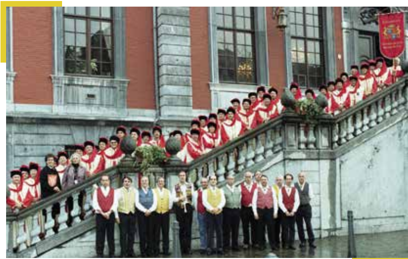
▲ Réception à l'hôtel de ville de Liège pour les 15 ans de la Baronnie

Longue vie à la Baronnie liégeoise, longue vie à la Commanderie des Costes du Rhône !