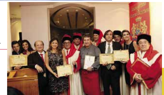
Chapitre à Rio de Janeiro ▶