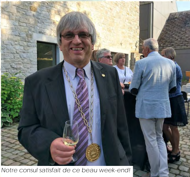
Notre consul satisfait de ce beau week-end!

La fidèle et toujours sympathique présence de nos amis de Gent et de Montreux montrent l'esprit d'amitié qui règne au sein de la Commanderie.