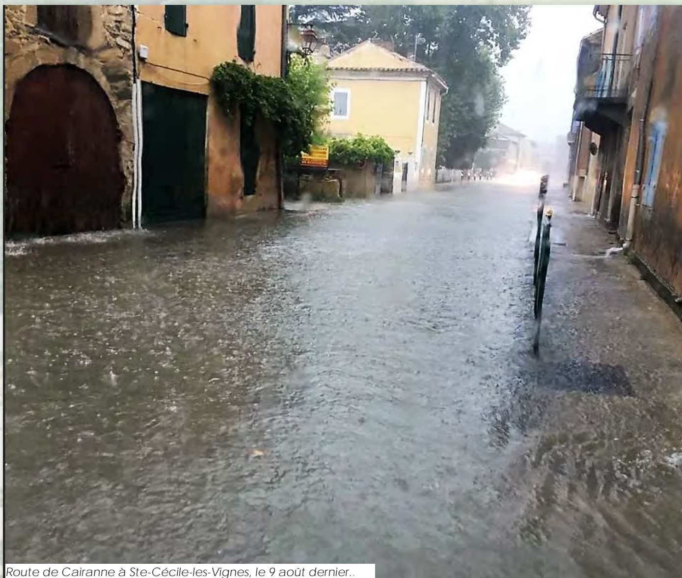
Route de Cairanne à Ste-Cécile-les-Vignes, le 9 août dernier..