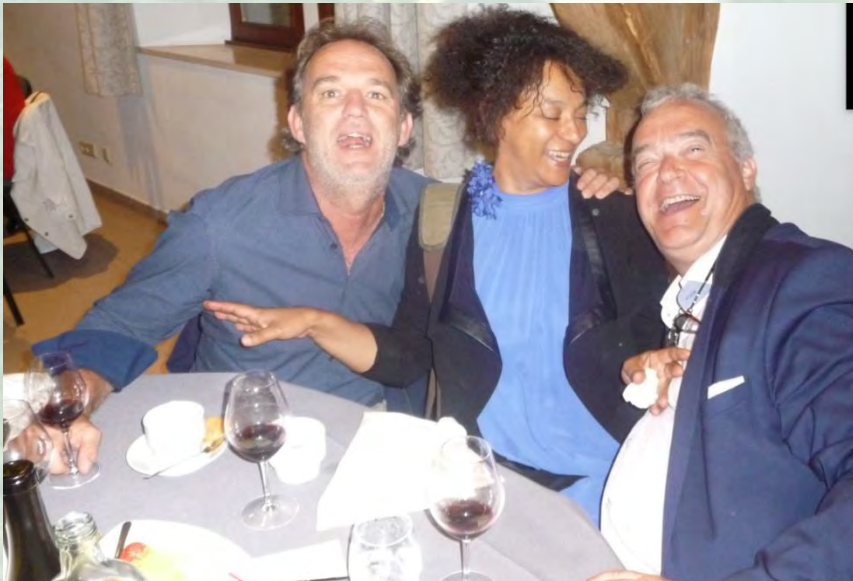
La consule très bien entourée...Mais que fait le Consul ?