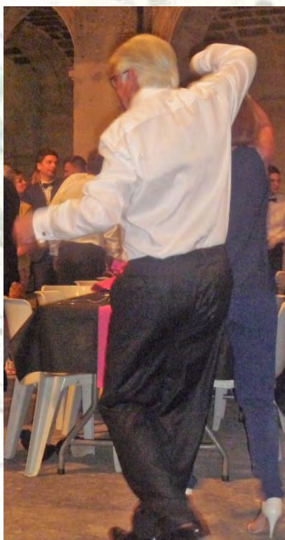
Le numéro 1 est donc bien le Grand Maître !

« Liège au fil du Rhône », se devait d'immortaliser cette scène !! Il est revenu aux oreilles de la rédaction que la danse n'est pas une habitude de nos deux consuls... En guise de conclusion à ce chapitre, nous allons évidemment faire la comparaison entre eux et le Grand Maître !!