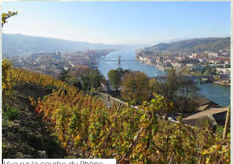
Vue sur la courbe du Rhône

L'alcool est à consommer avec modération mais surtout avec raison