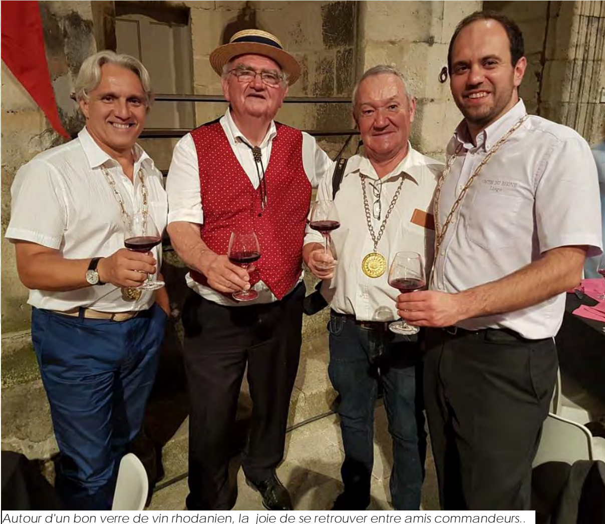
Autour d'un bon verre de vin rhodanien, la joie de se retrouver entre amis commandeurs..