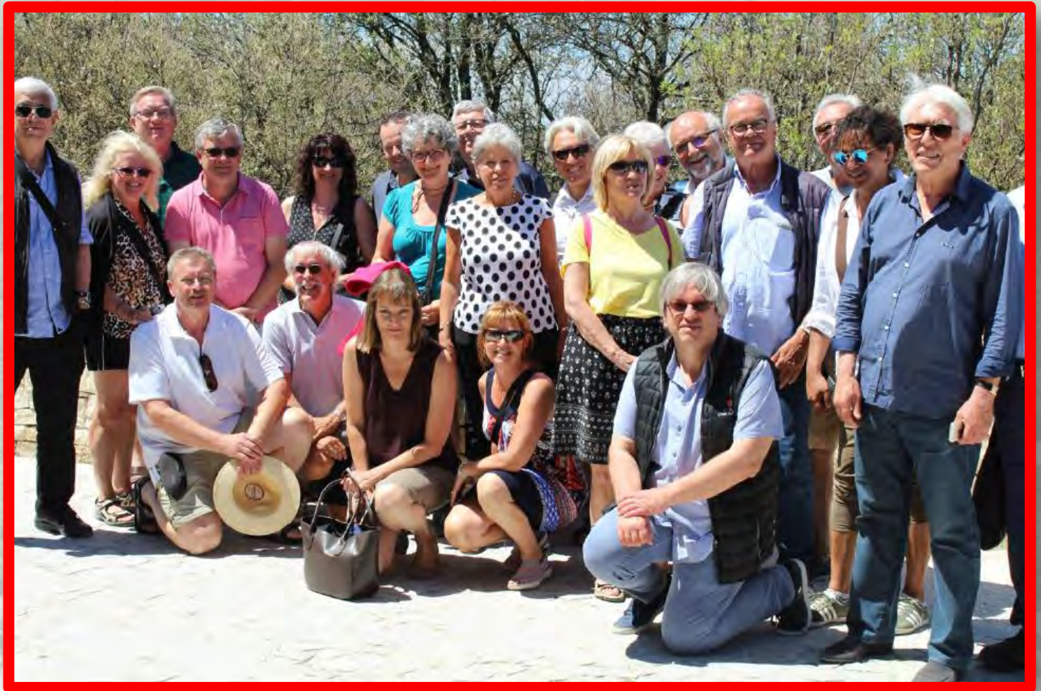
Photo souvenir du Mondial 2018

Merci à toutes et tous de leur présence pour ce beau Mondial 2018 ! Un merveilleux groupe !